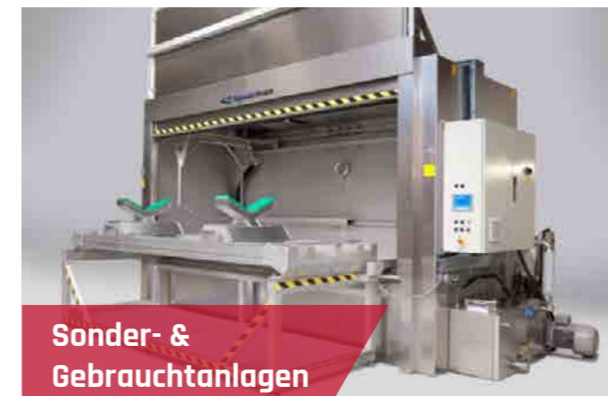
Sonder- & Gebrauchtanlagen