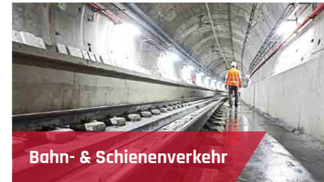
Bahn- & Schienenverkehr

Wir bieten Ihnen umfassendes Know-how im Bereich der industriellen Teilereinigung. Dabei sind unsere Lösungsangebote exakt in dem Maße spezialisiert, wie es die jeweilige Branche erfordert.