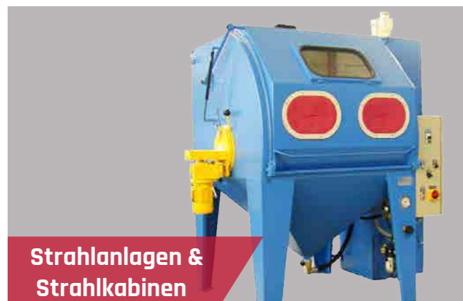
Strahlanlagen & Strahlkabinen