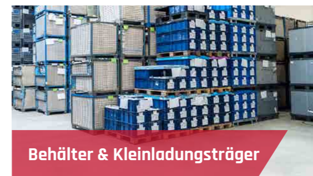
Behälter & Kleinladungsträger

Bei der Reinigung von Flugzeugfelgen, Radlagern, Bolzen, Muttern und Bremsenteilen für die Luftfahrtindustrie werden höchste Ansprüche an die Konzeption der Reinigungsanlagen gestellt. Zum Beispiel Triebwerkskomponenten, in der Felgen- und Räderreinigung sowie der Reinigung von Rumpfteilen.