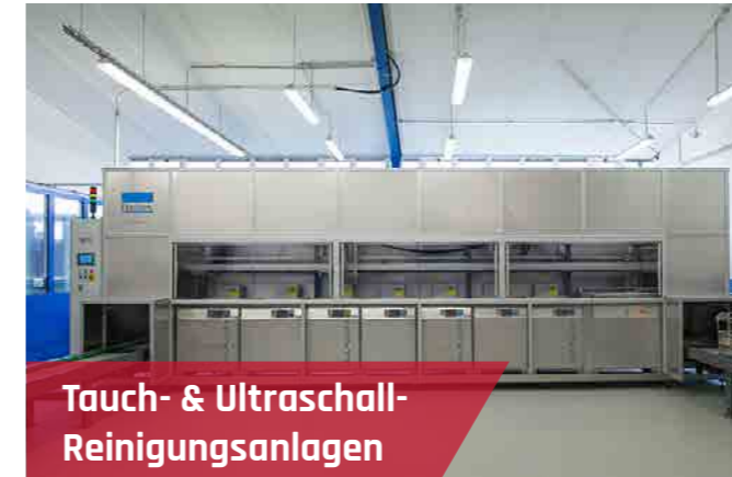
Tauch- & Ultraschall-Reinigungsanlagen

ganz individuellen Herausforderungen passt. Um hierbei ein optimales Ergebnis zu erzielen, beziehen wir alle relevanten Parameter – Chemie, Mechanik, Waschzeit und Temperatur – in die Konzepterstellung mit ein.